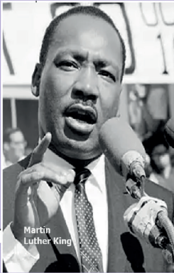
Martin Luther King